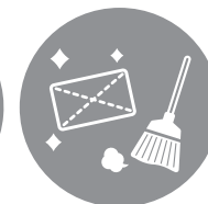
清掃代行 (週1回/1時間)