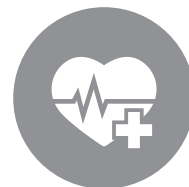
安否確認サービス